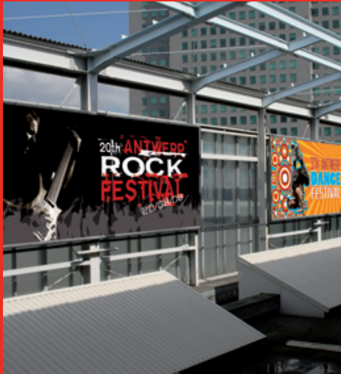
Großformatige Banner für den Außenbereich