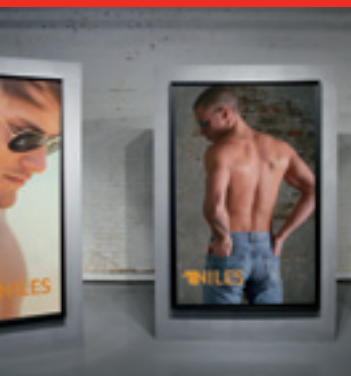
Kommunikation mit Hintergrundbeleuchtung