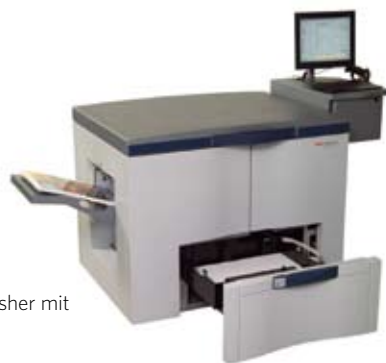
Kodak NexGlosser-Hochglanz-Finisher mit erweiterten Leistungsmerkmalen

**Der Glanzgrad hängt vom Papier, den Umgebungsbedingungen und dem Bildinhalt ab.